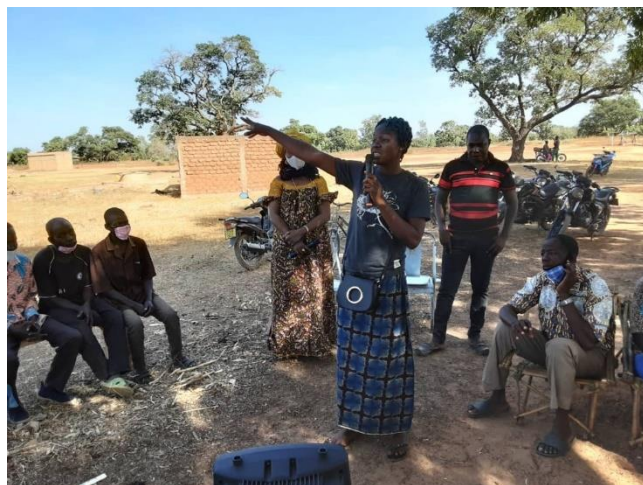
Une animatrice de SOSJD en pleine sensibilisation

Au cours de l'année 2020, les résultats suivants ont été atteints :