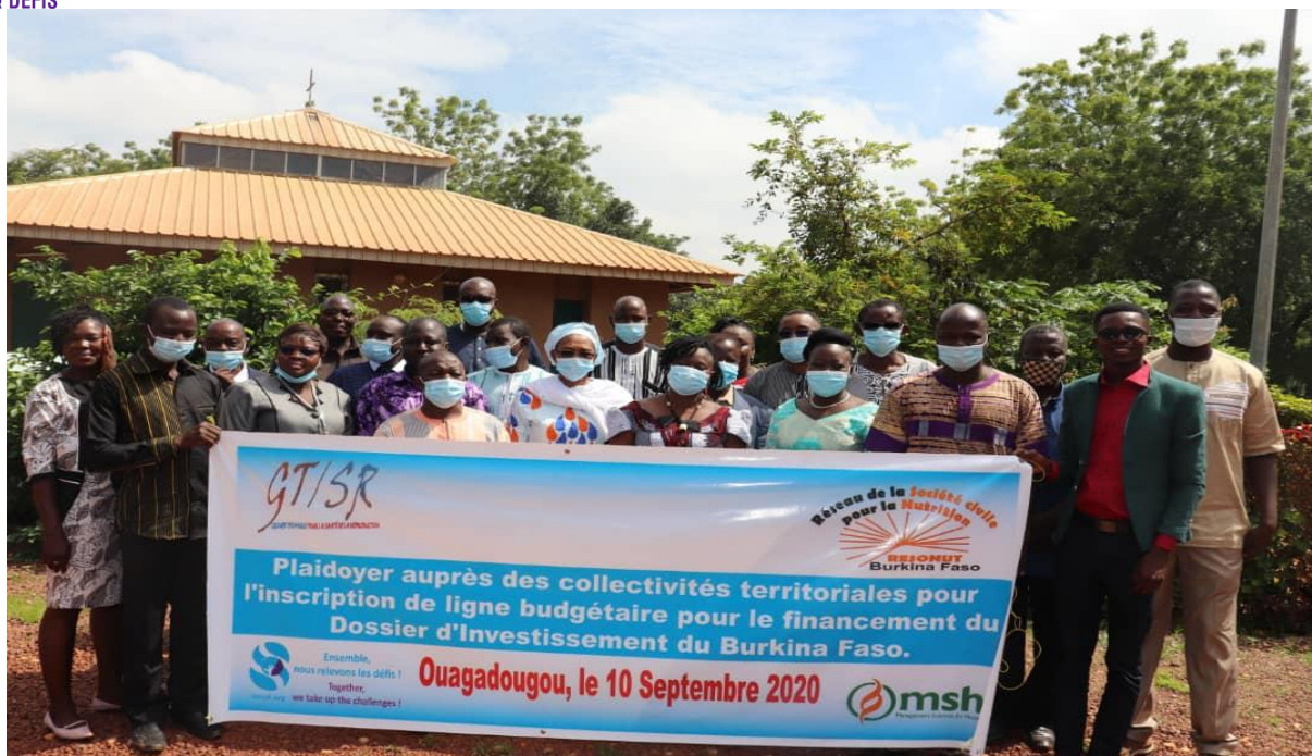
Photo de famille de l'atelier de plaidoyer auprès des collectivités territoriales

Au nombre des résultats et acquis, nous avons :