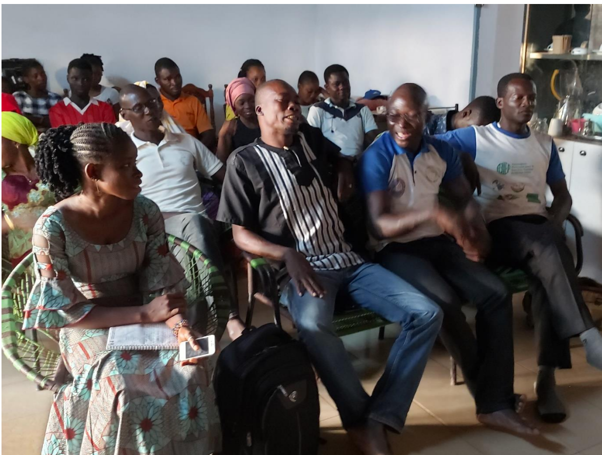
Photo : Cadre d'échange avec une trentaine de jeunes du quartier Somgandé pour la réduction des avortements clandestins

thématique de l'avortement sécurisé selon la loi. Le but étant de réduire les avortements clandestins. Au total 6 causeries éducatives ont été menées et touchées 258 personnes (25 hommes et 253 femmes).