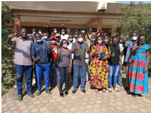
Photo de famille des jeunes leaders